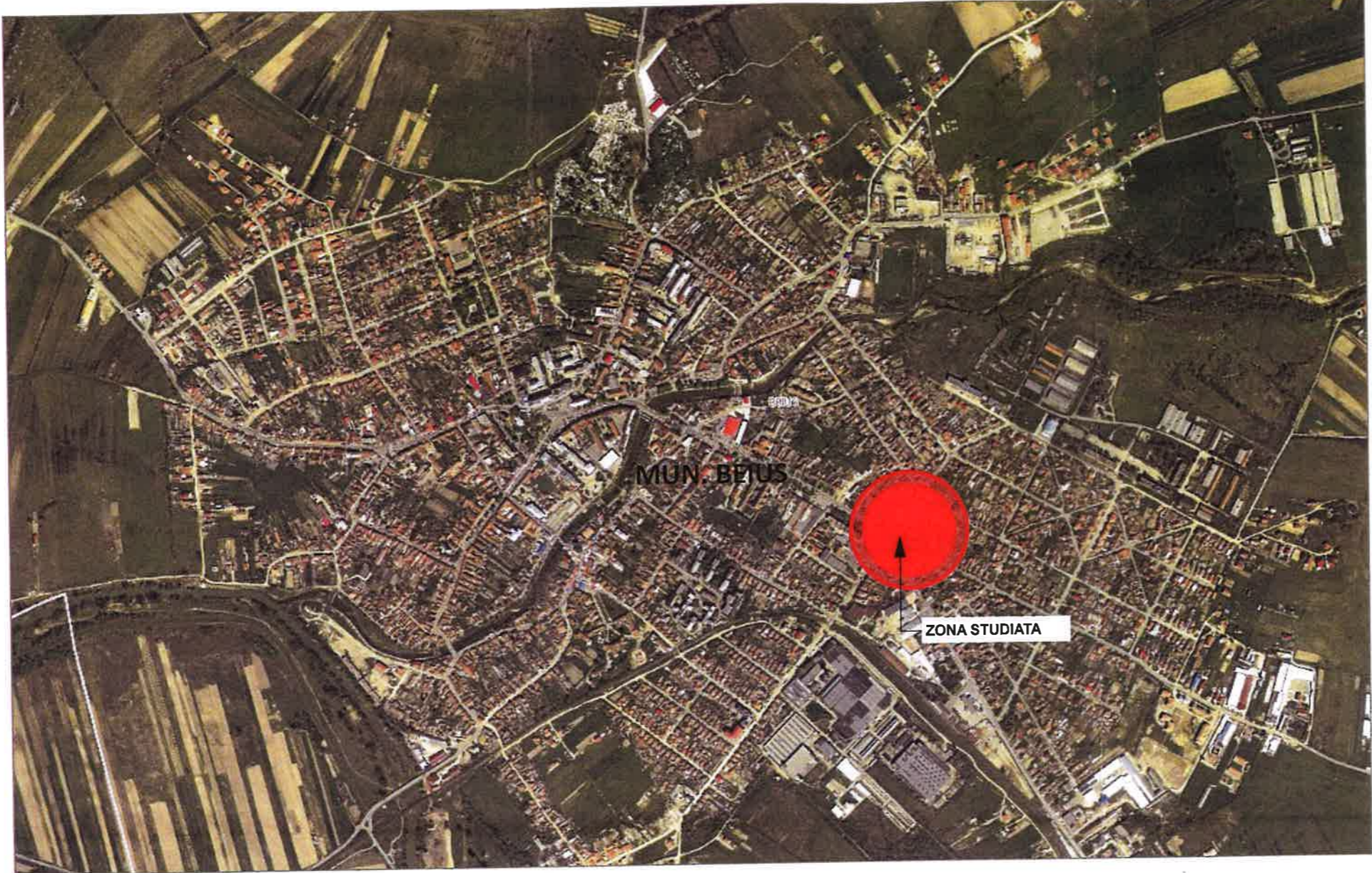
PLAN DE INCADRARE IN ZONA